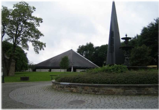
Eglise et la place communale.