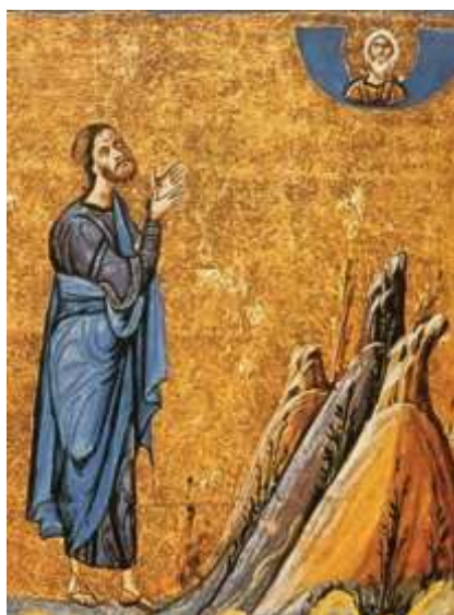
Jésus en prière – Mont Athos