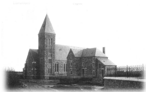
La première église et le presbytère vers 1910 L.S.